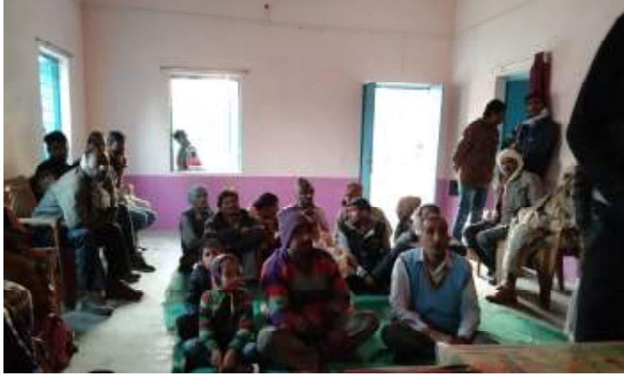
Gram Sabha Meeting in Hirapur GP