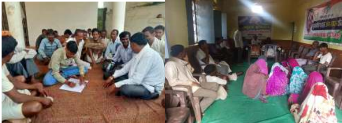
(GP MULPAR and GP Dhesai)